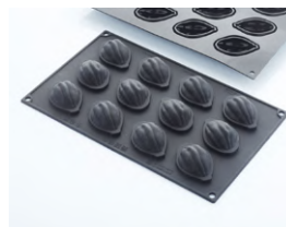
Форма для выпечки «Какао-бобы» [12 ячеек] силикон; Н 23, L 55, В 35 мм; чёрный 4147973 / 30SIL520