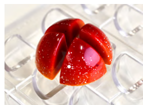
Форма для шоколада «Квартус» [24 шт] пластик; Н 26,5 L 27, В 27 мм; прозр. 4147980 / 21MA1066