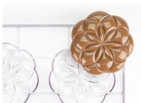
Форма для шоколада «Цветок жизни» [2 шт] пластик; Н 12,5 L 109, В 107 мм; прозр. 4147978 / 21MA2030