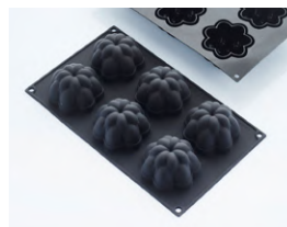
Форма для выпечки «Георгины» [6 ячеек] силикон; Н 43, L 71, В 70 мм; чёрный 4147975 / 30SIL518