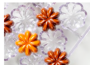
Форма для шоколада «Звезда» [15 шт] пластик; Н 15, L 38, В 38 мм; прозр. 4147981 / 21MA1067