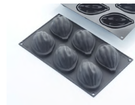
Форма для выпечки «Какао-бобы» [6 ячеек] силикон; Н 39, L 95, В 61 мм; чёрный 4147974 / 30SIL519