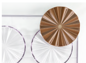
Форма для шоколада «Плиссе» [2 шт] пластик; D 110, Н 12 мм; прозр. 4147979 / 21MA2031