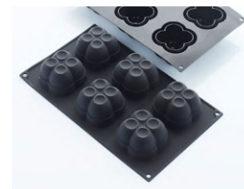
Форма для выпечки «Хлюя» [6 ячеек] силикон; Н 40, L 61, В 61 мм; чёрный 4147976 / 30SIL517