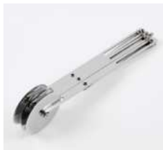
Нож для теста роликовый (3 лезвия)