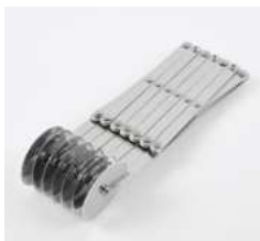
Нож для теста роликовый (7 лезвий)