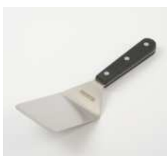
Лопатка кухонная изогнутая

L 245 мм; В 70 мм; Н 1,2 мм сталь нерж., полиоксимет. металлич., черный.