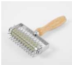
Валик для теста

L 195 мм; В 135 мм сталь нерж. металлич., деревян.