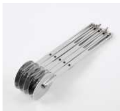
Нож для теста роликовый (5 лезвий)