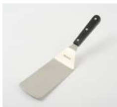
Лопатка кухонная изогнутая

L 308 мм; В 75 мм; Н 1,2 мм сталь нерж., полиоксимет. металлич., черный.