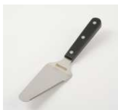
Лопатка кондитерская для торта

L 255 мм; В 60 мм; Н 1,2 мм сталь нерж., полиоксимет. металлич., черный.