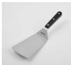
Лопатка кухонная изогнутая

L 295 мм; В 96 мм; Н 1,5 мм сталь нерж., полиоксимет. металлич., черный.