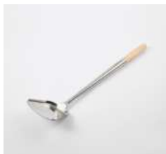
Лопатка кухонная с деревянной ручкой

L 475/105 мм; В 120 мм сталь нерж., дерево.