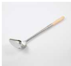
Лопатка кухонная с деревянной ручкой

L 450/100 мм; В 108 мм сталь нерж., дерево.