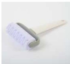
Нож для теста роликовый фигурный